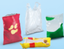
Sacs et sachets